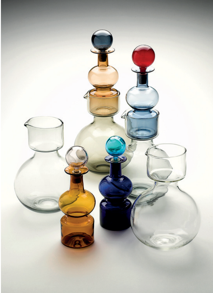
KAJ FRANCK: KREMLIN KELLOT, 1957, NUUTAJÄRVI