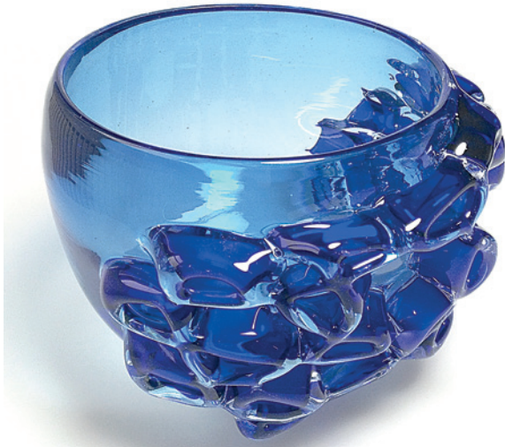
SAARA KORPPI: MUSTIKASSA, 2019.