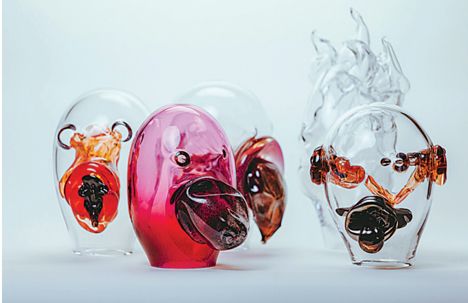
TOMMI TOIJA: METAMORFOOSEJA-NÄYTTELYYN VALMISTUNEITA ESINEITÄ, 2021.