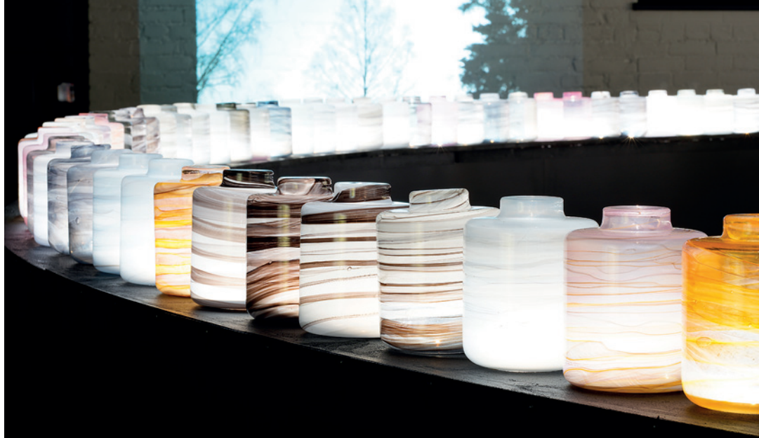
KIRSTI TAIVIOLA: EMPIRIA