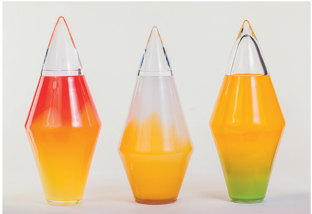
KIMMO REINIKKA: KOLME AATOSTA, 2021