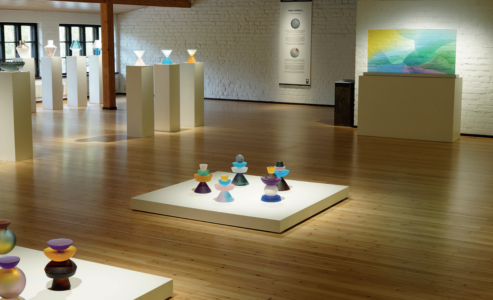
SAULI SUOMELA: STRUCTURAL LANDSCAPES | KUVA LARI LÄTTI