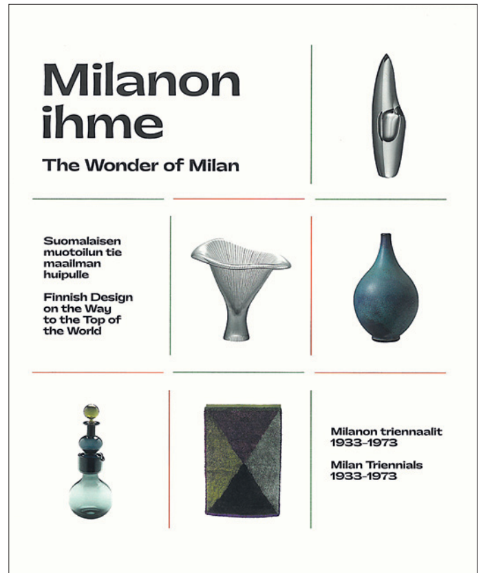
MILANON IHME - SUOMALAISEN MUOTOILUN TIE MAAILMAN HUIPULLE