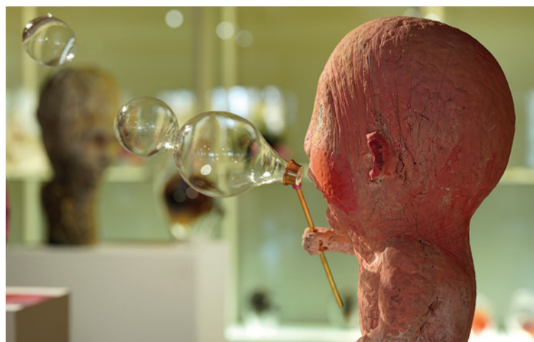
TOMMI TOIJA: METAMORFOOSEJA

OHEISOHJELMA: Taiteilijatapaminen 10.4.2021. Julkaistu Suomen lasimuseon YouTube-kanavalla.