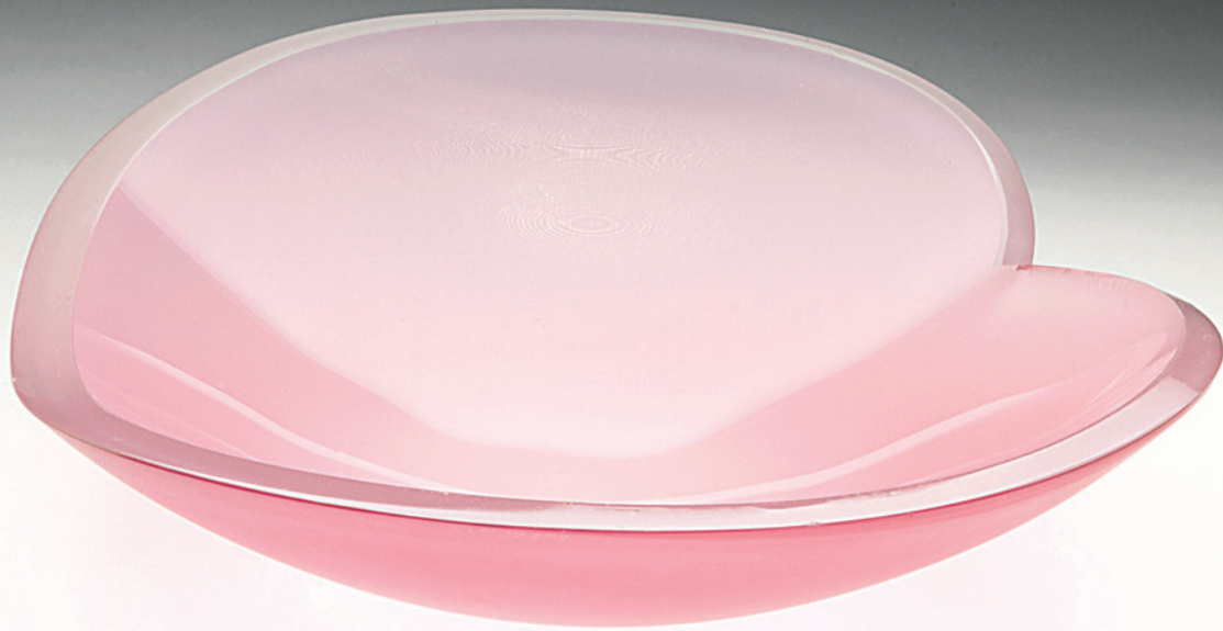
GUNNEL NYMAN: RUUSUNLEHTI, 1948, NUUTAJÄRVI