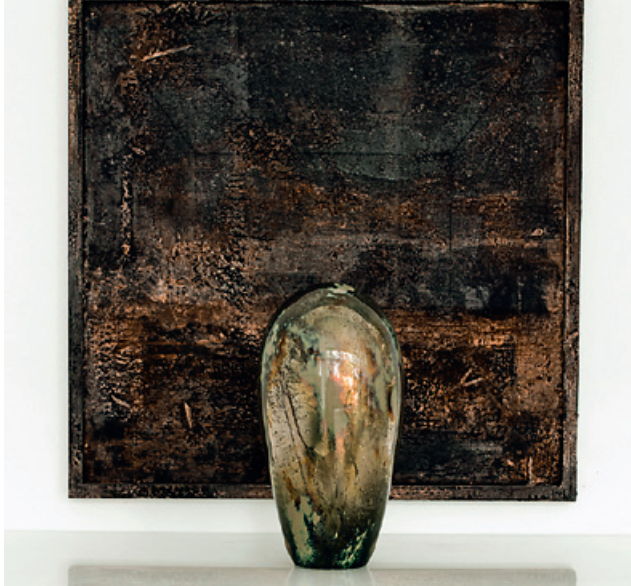
Tatu Vuorio: Elegia 2019.