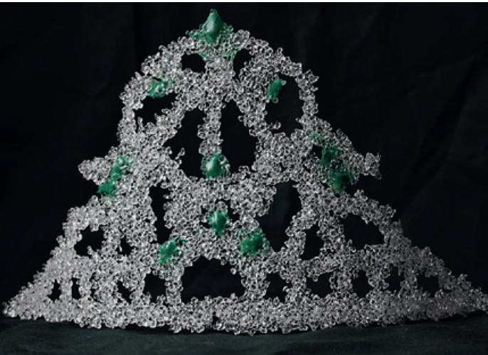
Helinä Koski: Dreams 2019.