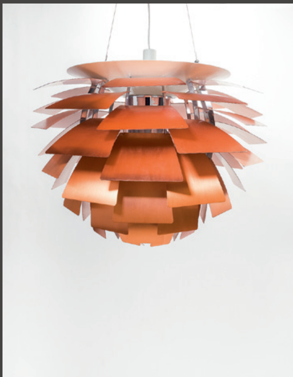
Poul Henningsen: PH Artichoke, 1958, kupari, ruostumaton teräs.