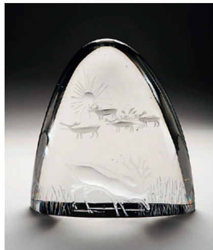
Tapio Wirkkala: Tunturi 1950.