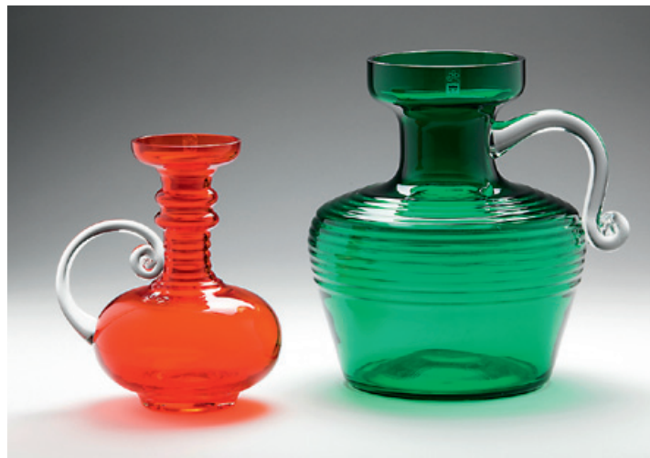
Tamara Aladin: Kleopatra 1970.