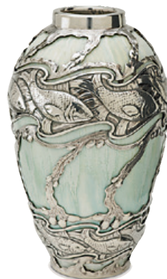
Hopeapäällysteinen maljakko, Royal Copenhagen, A. Michelsen 1900/1907, posliini, hopea