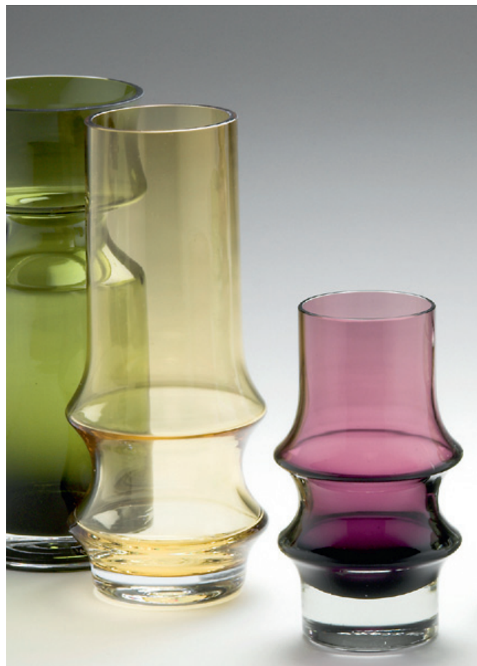
Tamara Aladin, Pyörittäen puhallettuja verholasimaljakoita 1965–1966.